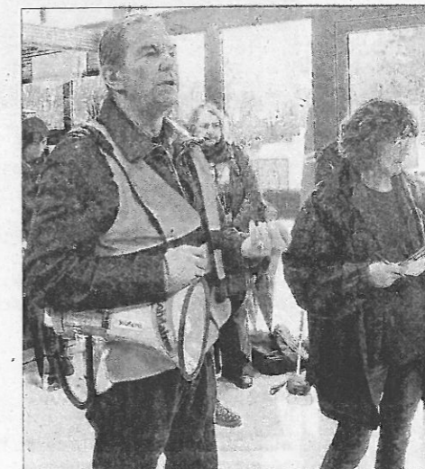
Les représentants syndicaux de Unitaires et de la CGT ont pris, tour à tour, la parole.

D'autres trésoreries rurales voient leurs horaires réduits, avec la fermeture de leurs portes les après-midis. Ce sont des établissements, comme ceux, entre autres, de Saint-Péray, Vallon-Pont-d'Arc ou encore Villedieu-de-Berg qui seront impactés.